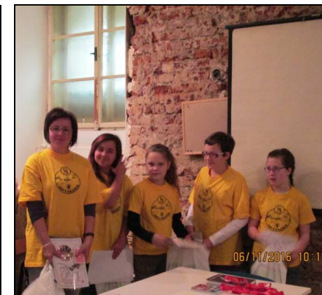
Text a foto: Radka Machová