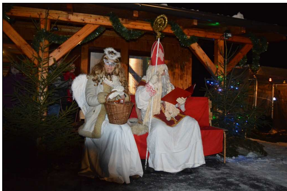
Mikulášský večer na hasičském cvičišti