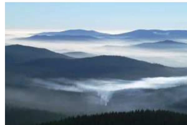
Výhled z rozhledny (ilustrační foto)

Stavba nových rozhleden na hřebeni Orlických hor se zřejmě minimálně o rok odkládá. Vyhlídkové věže měly vyrůst na Velké Deštné, v Olešnici, Novém Hrádku a také ve Vysoké Srbské na Broumovsku. Všechny byly součástí česko-polského projektu, který se ucházel o evropskou dotaci. Jenže o jejím přidělení se nakonec vůbec nerozhodovalo - ještě před tím totiž ministerstvo pro místní rozvoj projekt ze seznamu žadatelů o podporu vyškrtlo, a to kvůli administrativní chybě.