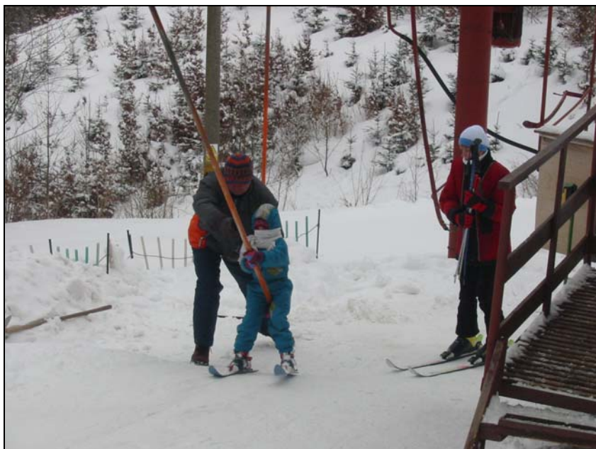
Lyžařský vlek - 320 m, 2 sjezdovky, rolba