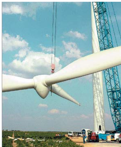
V Pávově nedaleko Dlouhé Brtnice byly letos v červenci vztyčeny dvě větrné elektrárny VESTAS V90-2,0 MW (na snímku záběr z jejich instalace). Také tam byla investorem společnost ELDACO.