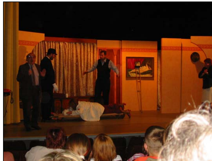
Divadelní představení Habaďůra aneb Nájemníci pana Swana