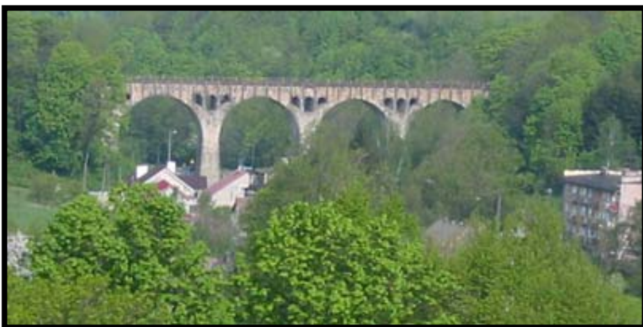
ŽELEZNIČNÍ MOST V LEWINĚ

Letošní 22. ročník Hrádouské vařečky byl poslední akcí Frymbursko-Olešnických slavností. Tento projekt finančně podporovala EU.