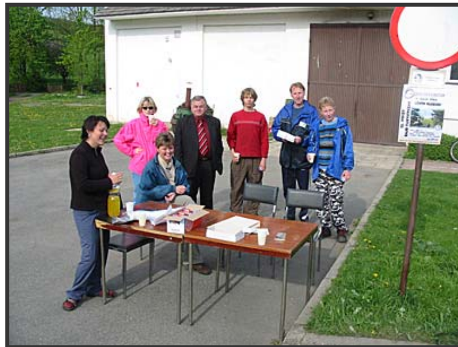
KONTROLA V LEWINĚ S PANEM STAROSTOU